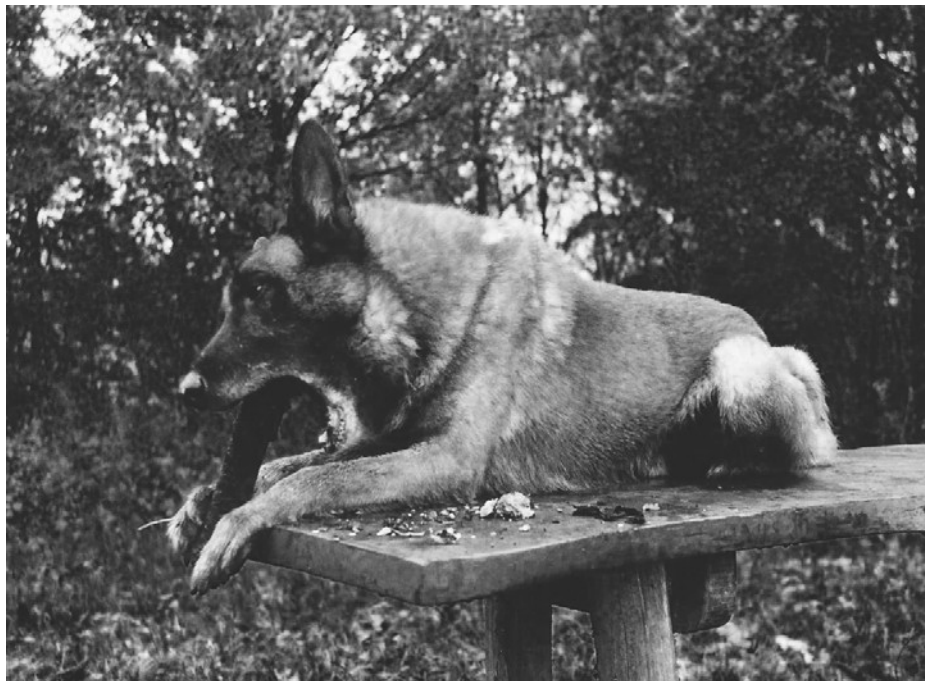
Barrie bezig met het vermalen van een stok.

Han zijn belager likte het overgebleven vet uit het doosje en rolde zich van genoeg door het losse mergelstof terplekke. Zonder hem nog een blik waardig te